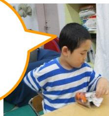
ちょっと気が 早いけど ハロウィン パフェを つくりました!