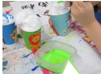
アートでは 9月になっても暑かったので かき氷をつくりました!