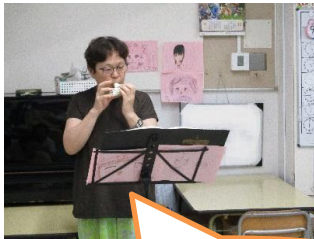
ボランティアの方による オカリナコンサートがありました!