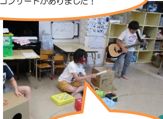
にじのこバンドで セッションしました!