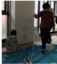
釣った魚は市場に持っていきます。魚の裏には価格が付いていて合計額が一番高い人が優勝!!