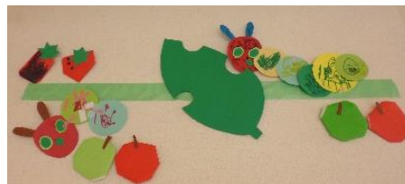
みんなで作ったはらぺこあおむし

下校時刻に変更がありましたら(遠足で遅い、開校記念日でいつもより早いなど)事前に連絡帳や電話などでお知らせください。営業時間外でも留守番電話、FAXで受け付けております。