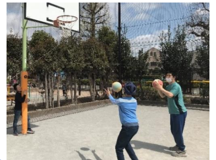
桜が咲き誇る中、六所神社や赤松公園、のびのび公園に散歩に出掛けました。公園では遊具や砂場で遊んだり、ボールやシャボン玉で遊びました。