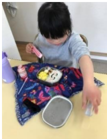
お楽しみのお弁当タイム