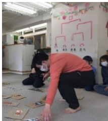
オセロのようにカードをめくり、時間内にどれだけ自分のカードをたくさん表にすることができるかを競っています。