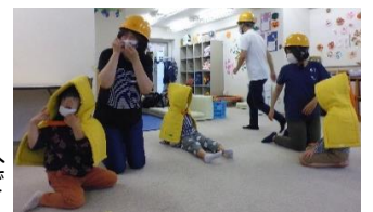
月に一度の避難訓練。回を重ねるごとにスムーズに。