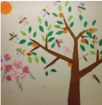
みんなが作った色鮮やかなトンボが飛び交っています。