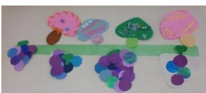
美味しそうな葡萄ときのこ。