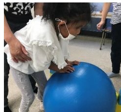
ピンを目掛けて転がしています。