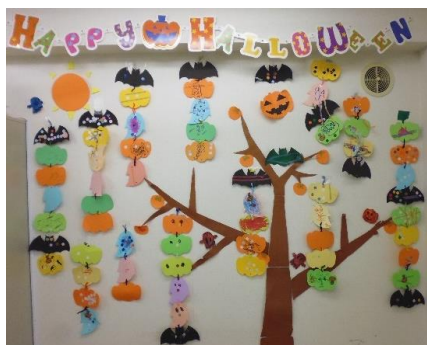
みんなが作った表情豊かなパンプキンが玄関で賑やかに出迎えてくれます。