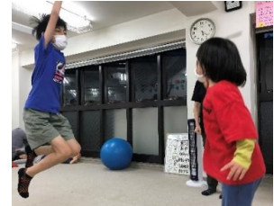
ジャンケンカード対決。勝ったー!!