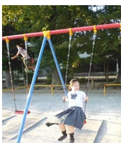
赤松公園でみんなでブランコ

日が短くなり、降所時には暗い道を帰ることも多くなってきたと思います。歩道が狭い道路が多く、車の交通量も多くなっています。反射ステッカーやキーホルダーなどの交通安全グッズを身に付けたり、車から見えやすい明るい色の服を着たりするなどの工夫をよろしくお願いします！