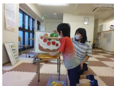
ケーキの歌に合わせて好きなフルーツを選んでトッピング