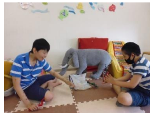
ウルトラマンビーム