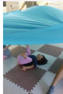
パラバルーンって気持ちいい～