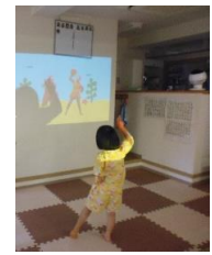
エピカイクスで踊っちゃおう