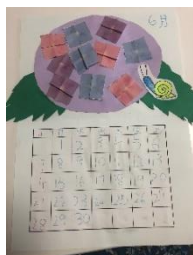
お家で素敵なカレンダーを作ってくれてありがとう!!