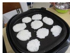
焼きおにぎり作り