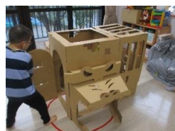
ダンボール秘密基地