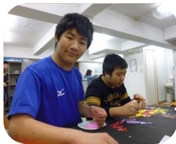
粘土でやしそば作り